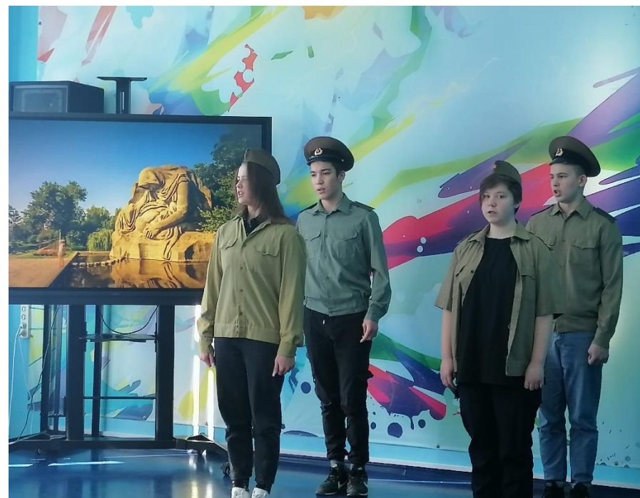
Инсценированный конкурс «Песни в военной шинели»