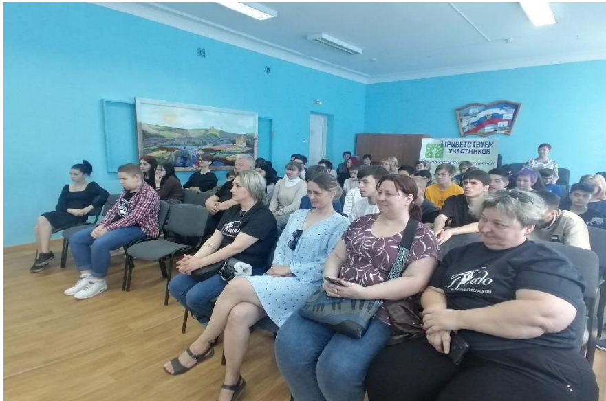
Концерт детских коллективов школы-наставника для детей и родителей МОБУ СОШ № 16 к Международному дню семей.